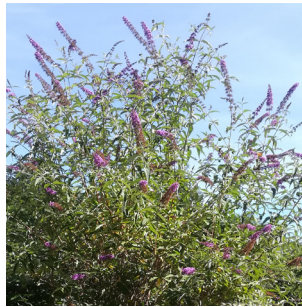
Buddleïa "Arbre à papillons"