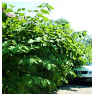
Renouée du Japon