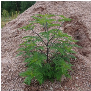
Ambrosie à feuilles d'armoise

Les EEE sont répertoriées dans des listes régionales ou territoriales. Parmi elles, voici quelques exemples d'EEE que vous pouvez retrouver dans vos jardins :