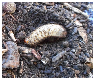
larve de cétoïne