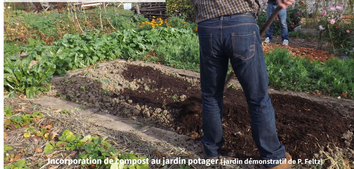
Incorporation de compost au jardin potager (jardin démonstratif de P. Feltz)

Pour en savoir plus : www.valtom63.fr rubrique : MON VALTOM > Publications > Zéro Déchet > "Mon guide du compostage et du jardinage au naturel"