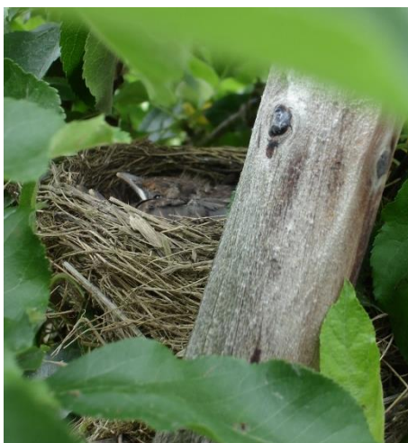
Nid dans pommier

Les conditions climatiques ont été exceptionnelles pour la vigne. Peu de maladies se sont développées (un peu d'oidium quand même). Chaleur et sécheresse donnent aux grappes une bonne qualité gustative.