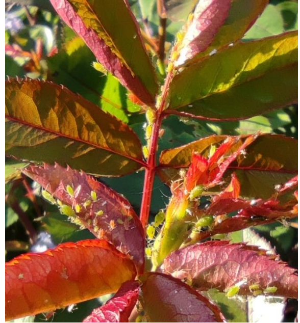
Colonie de pucerons verts sur jeune pousse de rosier