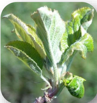
Enroulements de feuilles et colonie de pucerons cendrés ( Dysaphis plantaginae )

[NB : Sur pommier, le seuil indicatif de risque est atteint dès que 1 puceron cendré est observé dans la parcelle.]