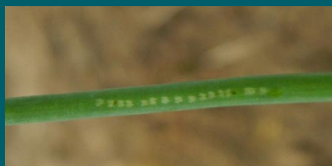
Piqûre de nutrition

de petits points blancs alignés verticalement. Ainsi, dès que les premières piqûres sont observées sur les feuilles de ciboulette, on en déduit que le vol est en cours et que la ponte est imminente. N'hésitez donc pas à planter des ciboulettes à proximité de votre jardin et à observer plusieurs fois par semaine, la présence ou non de piqûres.