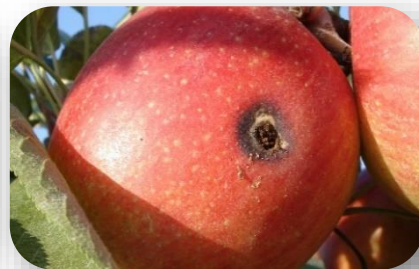
A gauche, papillon de carpocapse. A droite, dégât sur fruit