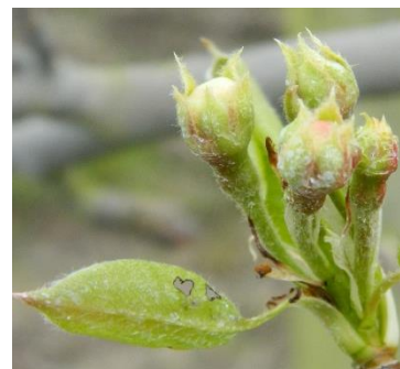
Chenilles défoliatrices Morsures de chenilles sur un bouquet floral.

Différentes chenilles (arpenieuses ou cheimatobies, noctuelles et tordeuses) peuvent dévorer les boutons floraux et plus tard, les jeunes feuilles. Ces chenilles s'observent dans les boutons floraux. On les repère aux dégâts occasionnés sur les boutons et sur les feuilles : morsures, filaments reliant les feuilles ou les boutons, déjections.