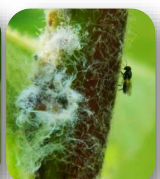
Photos : FREDON CVL. – Pucerons lanigères parasités à gauche et le parasitoïde Aphelinus mali à droite