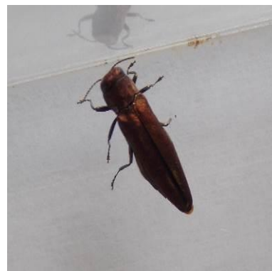
Adultes d'Agrilus du poirier –

L'adulte attend des conditions de températures plus favorables pour sortir de sa loge nymphale.