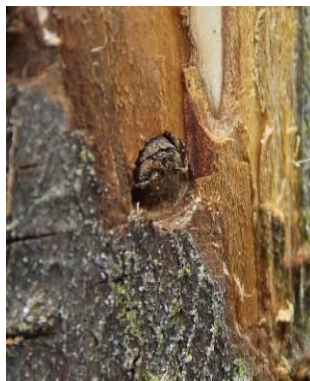
Tête de l'adulte sortant de l'orifice d'émergence

L'adulte attend des conditions de températures plus favorables pour sortir de sa loge nymphale.