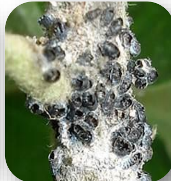
Pucerons lanigères parasités à gauche et le parasitoïde Aphelinus mali à droite