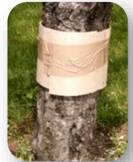
Bande piège cartonnée pour piégeage de chenilles de carpocapses