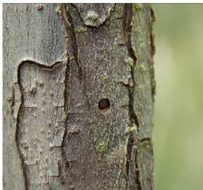
Agrilus du poirier Orifice de la future émergence de l'adulte. taille : 7 à 10 mm

Des adultes ont été signalés dans des vergers de professionnels en Indre et Loire (secteur Chouzé sur Loire).