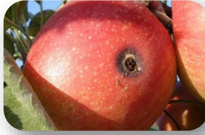
A gauche, papillon de carpocapse. A droite, dégât sur fruit