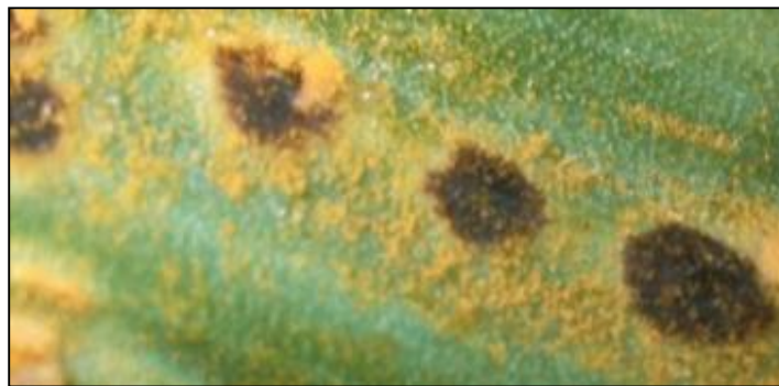
dégâts de rouille sur ail à gauche. A droite, observation de pustules de rouille sur poireau