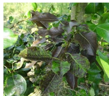
Folletage du feuillage sur poirier (brunissement brutal du feuillage – (Attention : les nervures restent vertes.).