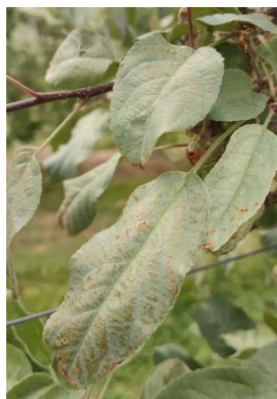
Plomb parasitaire sur pommier : décoloration gris argenté du feuillage (aspect plombé), localisée sur la partie au-dessus de l'impact ayant permis la contamination (Symptômes apparus mi-mai sur ce pommier).