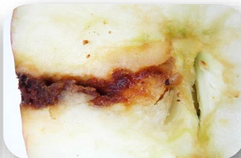
A gauche, dégâts externes de carpocapse sur pomme. Déjection visible à la sortie du trou. A droite, dégâts internes de carpocapse sur pomme. Galerie encombrée de déjection. La chenille a atteint une loge de pépins.