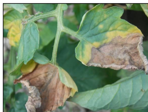
Taches de pourriture grise sur le feuillage