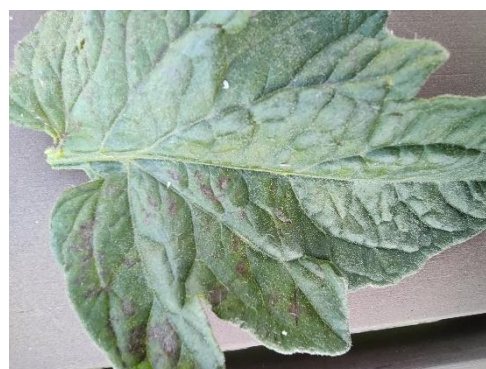
Taches brunes sur et sous une feuille de tomate