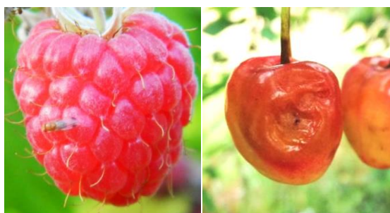
D. suzukii mâle sur framboise / Pourriture due aux larves sur cerise

Les observations des pièges, suivis dans le cadre du réseau d'observation professionnel, montrent que les D. suzukii sont nombreuses dans les parcelles de fraisiers.