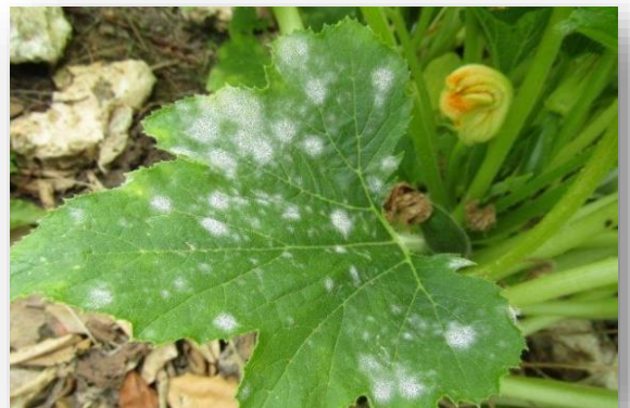
Taches d'oïdium sur courgette