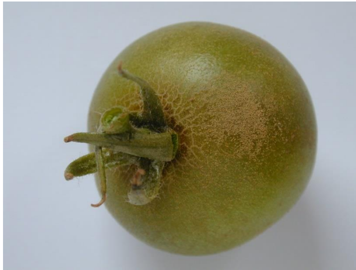
acariose bronzée sur fruit

Avec ce temps chaud et sec, certains jardiniers peuvent rencontrer ce ravageur sur leur culture de tomate aussi en plein champ que sous abris.