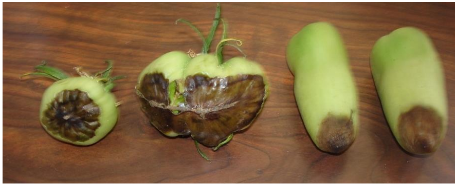
Cul noir sur différentes variétés de tomate. La localisation des taches et le contour très net de celles-ci ne permettent pas de confusion avec d'autres maladies.

Sur certaines variétés de tomates (cornue des Andes, andines ...), du cul noir s'est développé sur les fruits en cours de maturation.