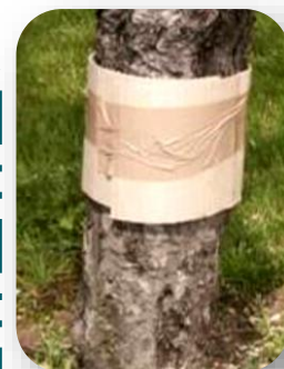
Bande piège cartonnée pour piégeage de chenilles de carpocapses