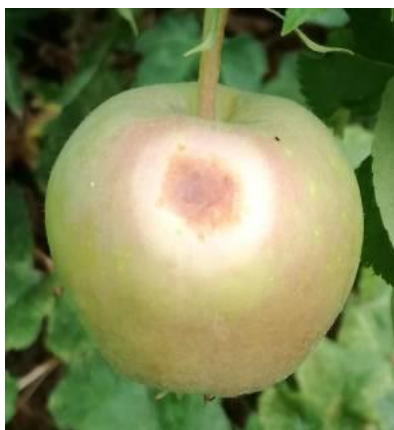
Coup de soleil sur la face la plus exposée au soleil du fruit.

Des symptômes de folletage du feuillage (déséquilibre entre la quantité d'eau absorbée par les racines et la quantité d'eau évaporée par les feuilles entraînant le noircissement du feuillage) sont signalés sur poiriers. Ce folletage du feuillage s'observe sur les variétés les plus sensibles ou sur les arbres les plus exposés. Plus classiquement, des symptômes de manque d'eau, avec un feuillage de couleur terne, perdant sa tonicité et prenant un port tombant en fin de journée ont pu être observés.