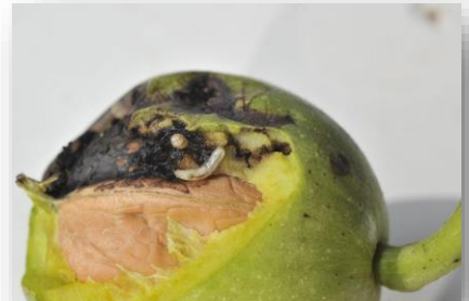
Brou noirci et larves de mouche du brou de la noix

La mouche du brou du noyer est un ravageur particulièrement néfaste pour la récolte de noix. En cas d'attaques, les premiers fruits tombés présentent des parties charnues du fruit (le brou de la noix) noircies et en partie décomposées. On observe, à l'intérieur de la partie noire du brou, des asticots jaunâtres. Cette décomposition noire est due au développement des larves dans la partie charnue, la rendant molle, humide et noire. Extérieurement, la peau du brou peut rester intacte mais la partie charnue pourrit, teinte la coquille de la noix et rend difficile le séchage de la noix. Les attaques précoces peuvent conduire à une chute des fruits. En cas de population importante, la production de noix de l'année est fortement réduite (jusqu'à 80% de dégâts).