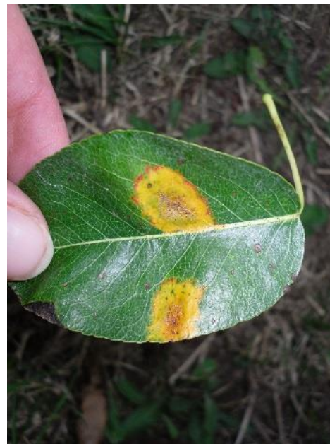
Symptômes de rouille grillagée sur feuille de poirier

Les symptômes sont caractérisés par l'apparition de taches orangées auréolées de jaune sur les deux faces de la feuille. A un stade plus mature, des excroissances apparaissent sur la face inférieure.