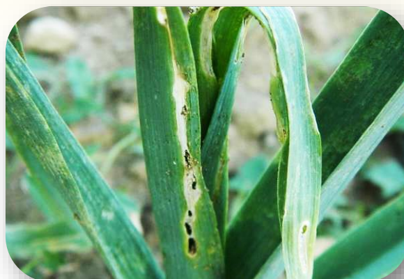
Dégâts de chenille sur poireau