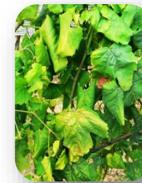
Non aoûtement ou aoûtement partiel des sarments