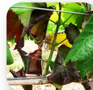
Dessèchement des inflorescences