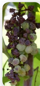
Dépérissement et/ou flétrissement des grappes