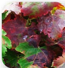
Coloration sectorielle sur nervures