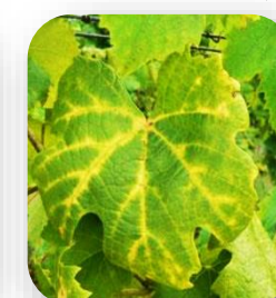
Coloration sectorielle entre les nervures