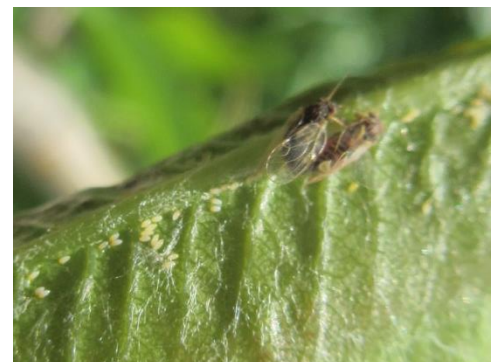
Adultes de psylles avec des pontes blanches

Les pontes sont en cours. Elles ont été observées dans 10 parcelles sur les 13 observées. Ce sont principalement des pontes fraîches de couleur blanche qui sont visibles sauf sur le secteur de Colmar, Obernai et Westhoffen où elles sont de couleur jaune, stade plus avancé. Le taux d'occupation des feuilles est assez stable autour de 10% sauf 4 parcelles avec 20% ou plus.