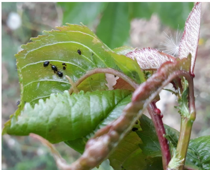
Puceron noir du cerisier

En cerisier , les premiers foyers de puceron noir ont été observés sur une des 2 parcelles suivies cette semaine.