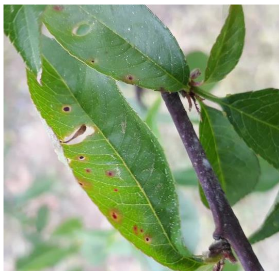
Criblure de coryneum sur feuille de pêcher

Les contaminations ont lieu au printemps lors des périodes pluvieuses. Le risque est en cours.