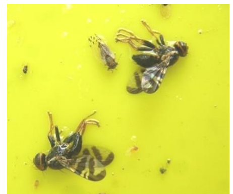
Mouches de la cerise capturées sur une plaque jaune

Il est temps de sortir le piège jaune englué afin de déterminer le vol de la mouche. Il sera possible dès la hausse des températures.