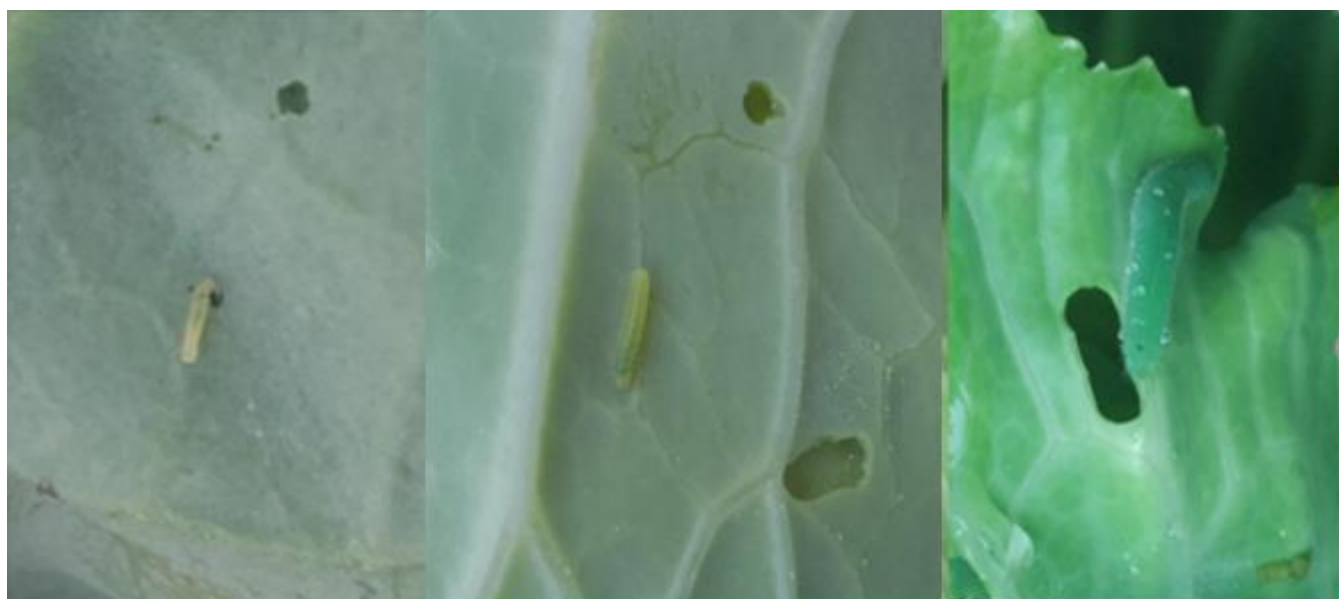
Différents stades larvaires de la piéride de la rave (A. Claudel)