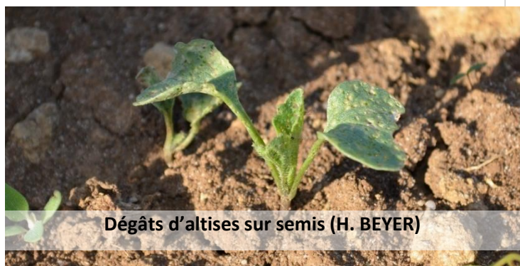
Dégâts d'altises sur semis (H. BEYER)

Peu d'altises ont été observées cette semaine, que ce soit sur de jeunes plants ou sur des choux déjà bien développés. La météo sèche prévue pour pourrait cependant favoriser leur retour, il faut donc rester vigilant sur les jeunes plantations et les jeunes semis.