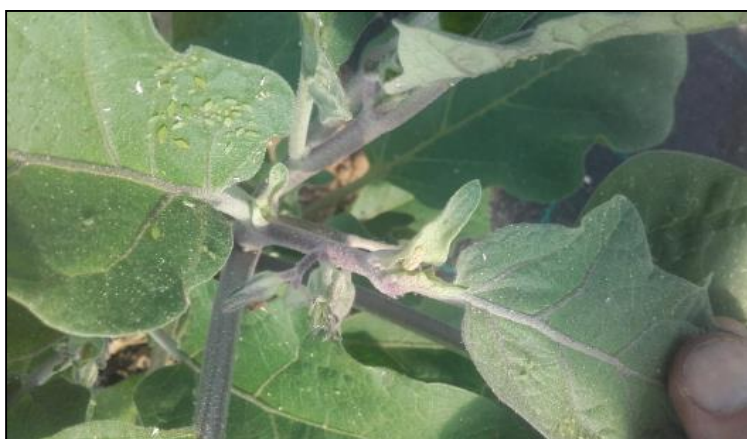
Colonie en développement de pucerons verts sur aubergine (H. BEYER)

Peu de pucerons ont été observés cette semaine sur solanacées et cucurbitacées. Quelques foyers sont observés sur aubergine, mais les auxiliaires présents permettent de maîtriser leur développement. Ils sont également présents sur melon sur un site. Sur les autres cultures (poivron, tomate, concombre, courgette), aucun foyer de puceron n'a été relevé. Il faut cependant rester vigilant, car la situation peut varier fortement d'un site à l'autre et dépend du développement des auxiliaires.