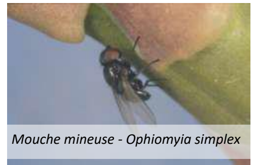
Mouche mineuse - Ophiomyia simplex

Quelques dégâts commencent à se faire voir comme des dessèchements de pieds. Mais souvent sans trop d'incidence. Pas de seuil défini.