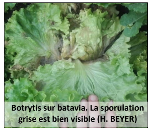
Botrytis sur batavia. La sporulation grise est bien visible

Les infections par le botrytis sont favorisées par une forte fertilisation azotée ainsi que par les blessures (y compris des pucerons) qui sont des points d'entrée de la maladie. L'espacement des têtes (10/m 2 au lieu de 12 ou 14) permet d'améliorer la ventilation de la culture et de diminuer la pression. La plantation sur plastique isole les feuilles du sol ce qui limite aussi l'infection.