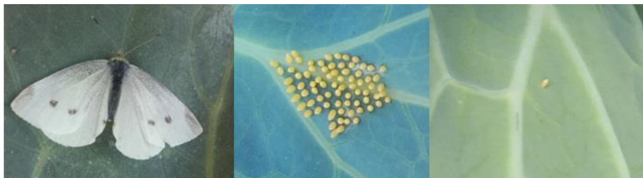
Papillon de piéride à gauche, ponte de la piéride du chou au milieu et ponte de la piéride de la rave à droite

La situation pour les chenilles phytophages peut varier d'un champ à l'autre, une surveillance régulière des parcelles est indispensable.