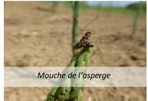
Mouche de l'asperge

Le vol touche à sa fin. Quelques dégâts sont visibles sur des parcelles, mais plutôt faibles, exceptées quelques parcelles fortement touchées.