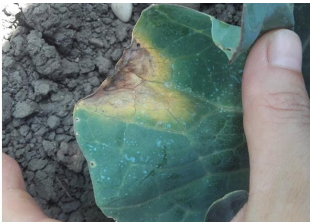
Xanthomonas sur chou pommé, lésion en forme de V (A. Claudel)