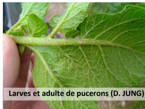
Larves et adulte de pucerons (D. JUNG)

Aucune méthode alternative efficace. Pour la production de plants, des huiles sont utilisables (également certaines en AB).