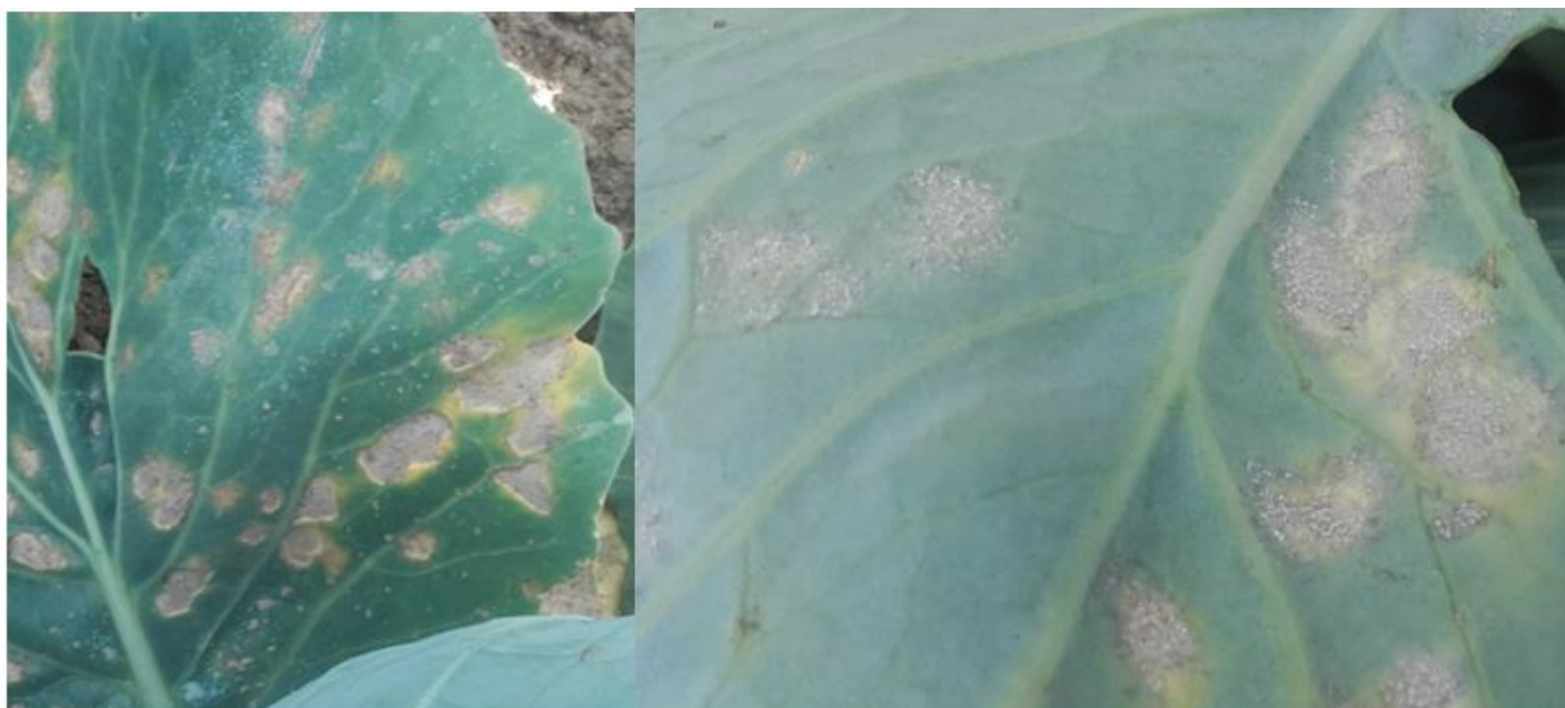
Mildiou sur chou pommé. A gauche symptômes sur la face supérieure de la feuille. A droite symptômes sous la feuille : sporulation blanche du champignon