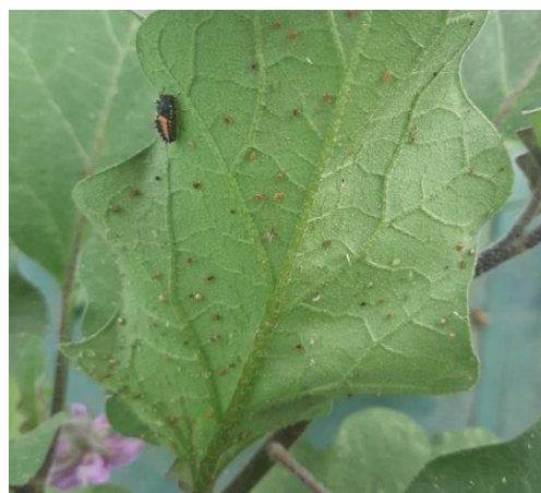
Larve de coccinelle et pucerons parasités (momies beige-doré) sur feuille d'aubergine (L.HUSSON)