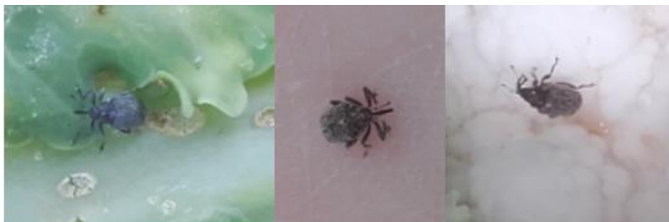
Charançon de la tige du colza (1 ère photo) et charançon du chou (les 2 photos suivantes)

Niveau de risque : faible à moyen sur chou au stade inférieur à 50% de pomaison.