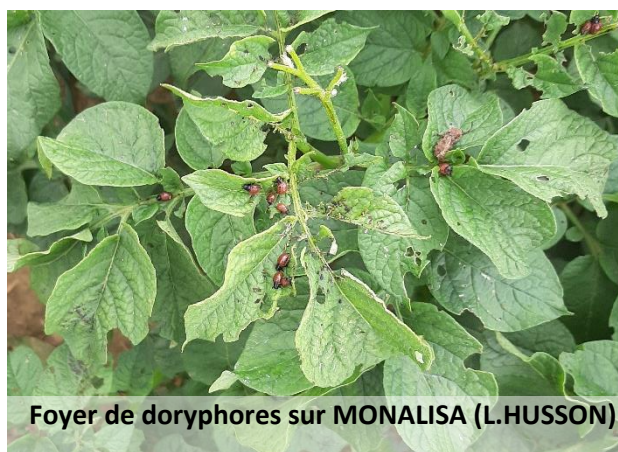
Foyer de doryphores sur MONALISA (L.HUSSON)

Les observations de cette semaine ont été effectuées sur deux sites dans les secteurs de Pont-à-Mousson et Longwy. Les variétés les plus précoces (Monalisa, Allians) sont en fin de floraison et ont des taux de matière sèche autour de 18%. Les pucerons ne sont plus présents mais ont pu faire des dégâts (transmission de viroses). Des doryphores sont en revanche observés. Les auxiliaires, notamment les larves de coccinelles, restent bien présents.