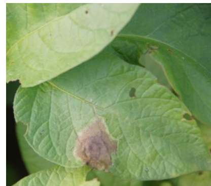
Tache de mildiou (D. JUNG)

Le modèle Mileos® d'Arvalis Institut du Végétal permet la modélisation du risque de la maladie selon la sensibilité variétale du feuillage en fonction des contaminations et des sporulations suivantes). Il faut que la parcelle ait atteint les 30 % de plants levés pour prendre en compte le risque mildiou.