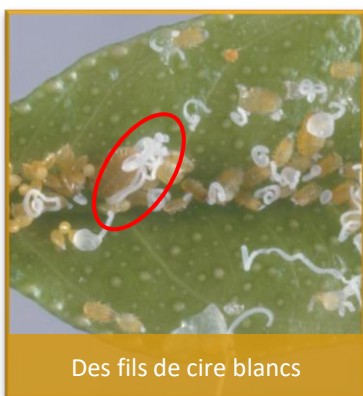
Des fils de cire blancs