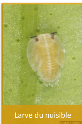
Larve du nuisible