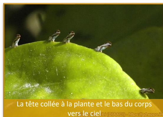
La tête collée à la plante et le bas du corps vers le ciel