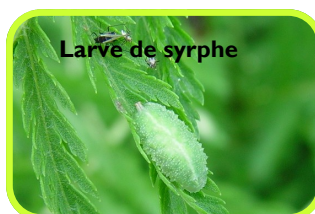
Larve de syrphe

La larve du syrphe , cette mouche à l'allure de guêpe qui a un vol stationnaire, s'attaque aux pucerons et à d'autres insectes comme les cochenilles.