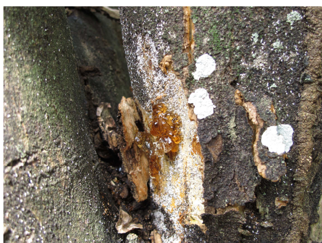
Gouttes d'exsudat brun (gomme)

Une autre expression de la maladie se manifeste sur fruit. Elle progresse entre juillet et décembre (hivernage) : les fruits jaunissent de façon prématurée en commençant au niveau de la cicatrice florale, puis des tâches brunes apparaissent en s'élargissant progressivement. Les fruits tombent rapidement au sol.