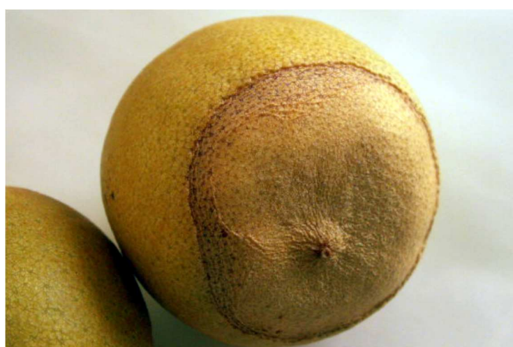
Tâches brunes sur fruits