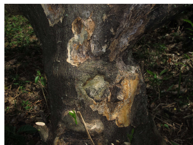
Disparition de l'écorce au niveau du tronc